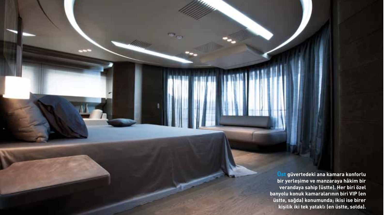
Üst güvertedeki ana kamara konforlu bir yerleşime ve manzaraya hâkim bir verandaya sahip (üstte). Her biri özel banyolu konuk kamaralarının biri VIP (en üstte, sağda) konumunda; ikisi ise birer kişilik iki tek yataklı (en üstte, solda).

hesapları ise High Modulus'a ait. 190 tonluk teknenin iki adet 3 bin 450 beygirlik MTU motorla ulaştığı en yüksek hız, tasarımın mühendislik ve konstrüksiyonla üst düzey uyumu sayesinde 25 knot'ı buluyor. 41 metrelik bir tekneyle bu hıza ulaşmak veya 19 knot'lık bir seyir hızı yakalamak, doğrusu pek de kolay değildir. E bunu yapanlar var dendiğinde, yanıt şu olur: Evet, bunu yapanlar gerçekten var, ama az sayıdaki bu tersaneler arasında Peri de var! Üstelik bunu, konvansiyonel tipte, göreceli olarak küçük iki motorla ve ekonomik yapanlar daha da az!